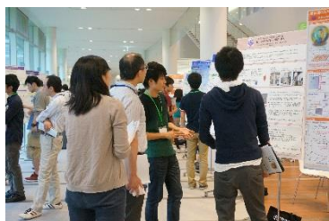
合同ポスターセッション